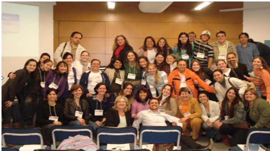
FNEPAS: UNIVALI e Secretaria de Saúde unidos pela qualidade de Ensino em saúde!