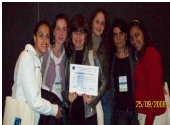
16° CONGRESSO BRASILEIRO DE FONOAUDIOLOGIA – CAMPOS DO JORDÃO/SP.